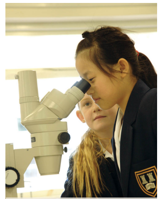
Девочка смотрит в микроскоп на уроке биологии.