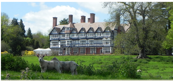
«Бедстоун Корт» – т. н. «календарный дом» с 365 окнами, 52 комнатами, 12 трубами и 7 дверями.