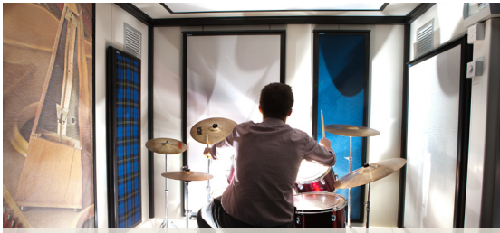
Урок игры на барабанах.