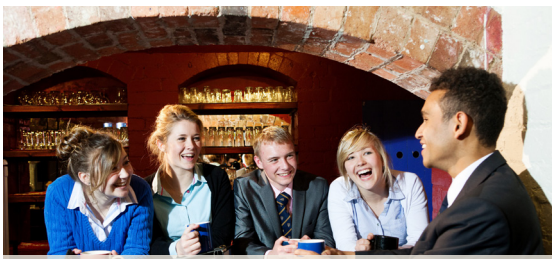
Ученики общаются на досуге в школьном баре для старшеклассников.