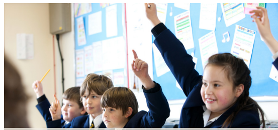
Уроки в «Бедстоуне» проходят активно и весело.