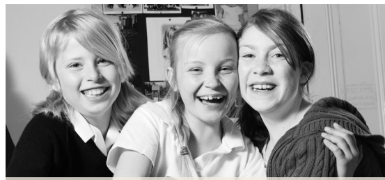
Три подружки в общежитии для девочек из младших классов.