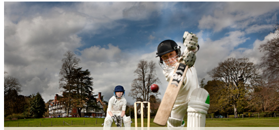
Ученики играют в крикет.