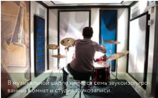
В музыкальной школе имеется семь звукоизолированных комнат и студия звукозаписи.