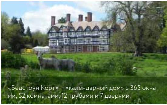
«Бедстоун Корт» – «календарный дом» с 365 окнами, 52 комнатами, 12 трубами и 7 дверями.