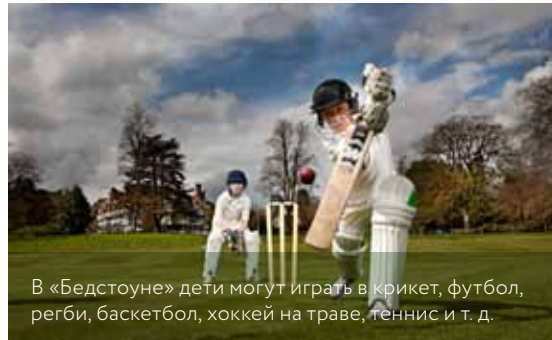
В «Бедстоуне» дети могут играть в крикет, футбол, регби, баскетбол, хоккей на траве, теннис и т. д.