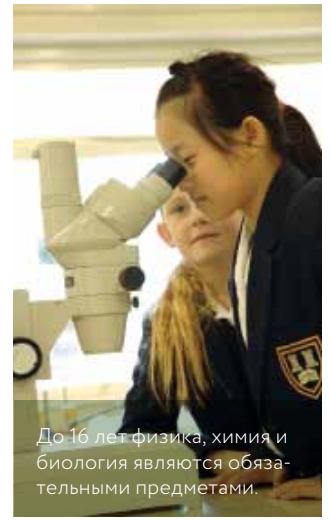
До 16 лет физика, химия и биология являются обязательными предметами.